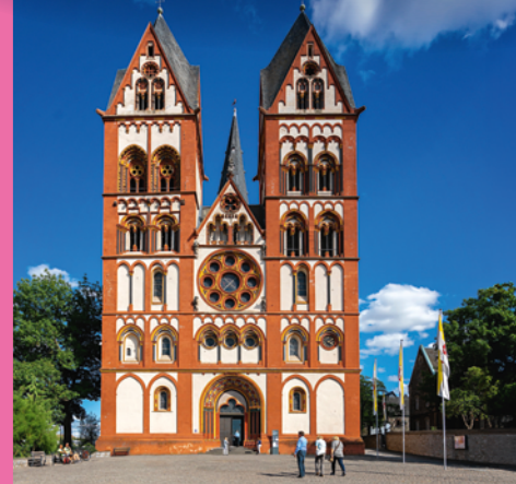
Wiesbaden / Rheingau / Untertaunus