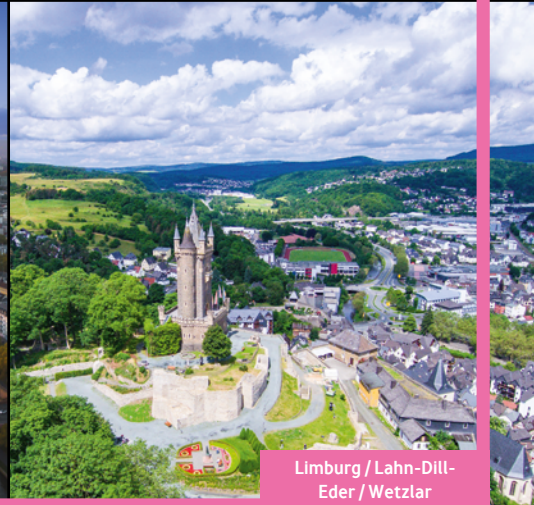
Limburg / Lahn-Dill- Eder / Wetzlar