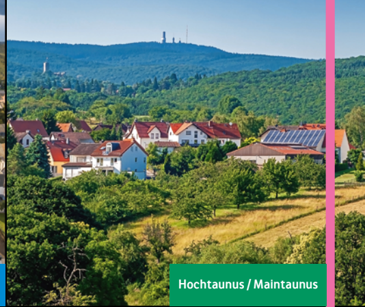
Hochtaunus / Maintaunus