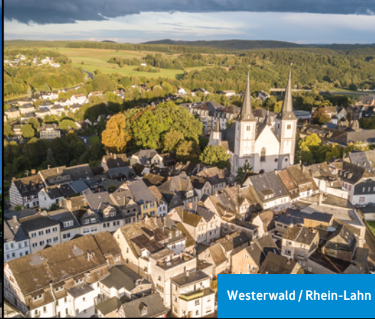
Westerwald / Rhein-Lahn